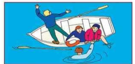
Поднимайте упавшего из воды только с кормовой части тонущего средства!