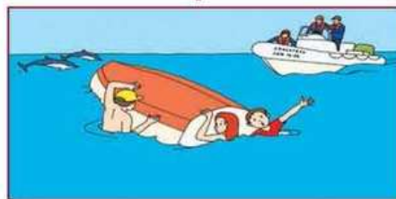
Не отплывайте от перевернувшейся лодки до прибытия подмоги!