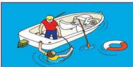
Используйте для спасения любые подручные средства!