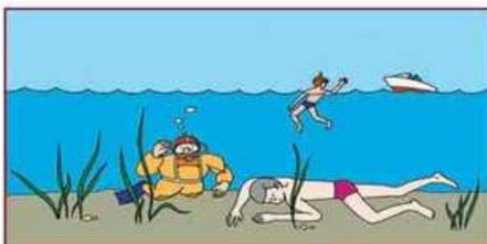
Не оставляете попыток достать утопающего со дна.