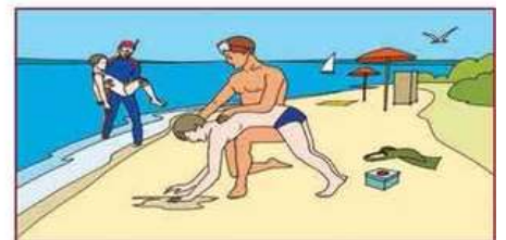
Доставив пострадавшего на берег, очистите ему полость рта и удалите воду из дыхательных путей, легких и желудка!

В любой ситуации на воде главное не паниковать!